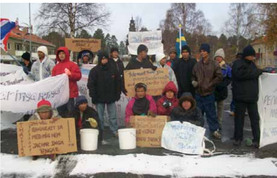
Thailändska bärplockare demonstrerar i Åsele i september 2010.

Exploateringen av asiatiska bärplockare har resulterat i en rad protester. I Åsele, Luleå och Storuman demonstrerade blåbärsplockare under augusti och